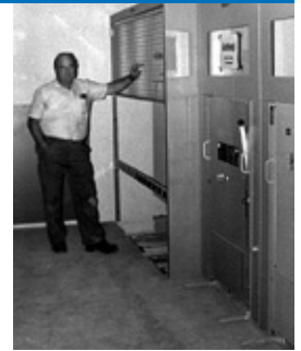
Neuer Trafo Kreuzplatz Arni 1987