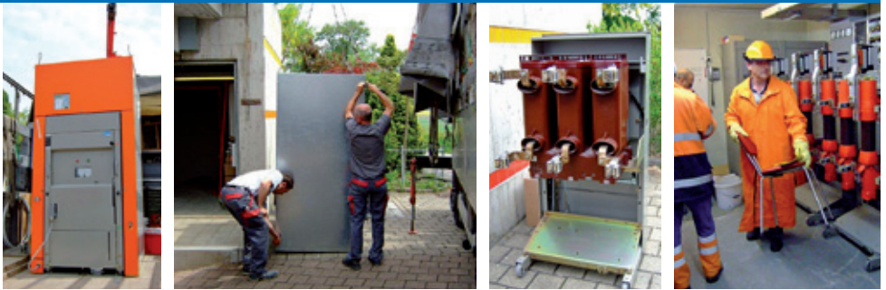
Einbau Sicherheitsschalter Sonnacker, 11. Mai 2009