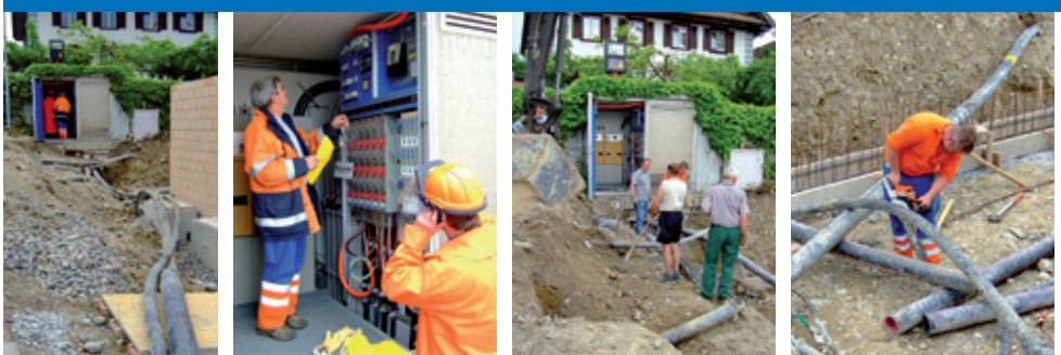
Baustelle Rigiblick, 11. Mai 2009